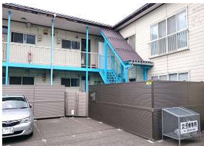
女子寮① 女子寮全景。平成 27 年に教員住宅を改装して設置。16 人入寮可能。