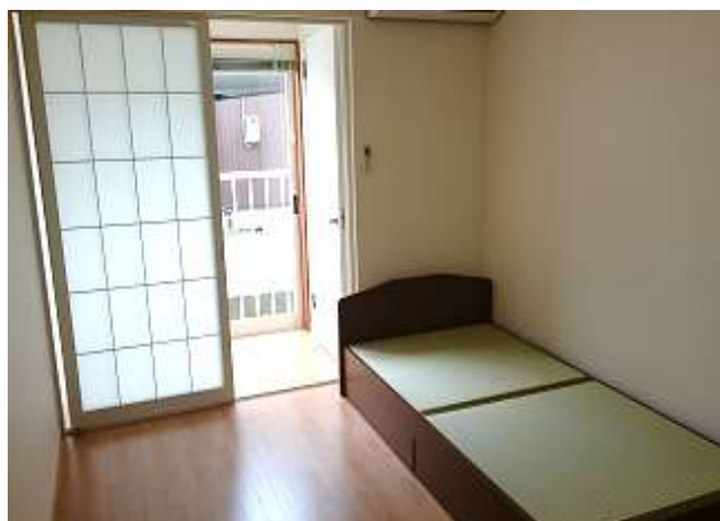
女子寮② 生徒個室（窓側）。2DKを2人で使用する。冷暖房完備。テレビ設置可。