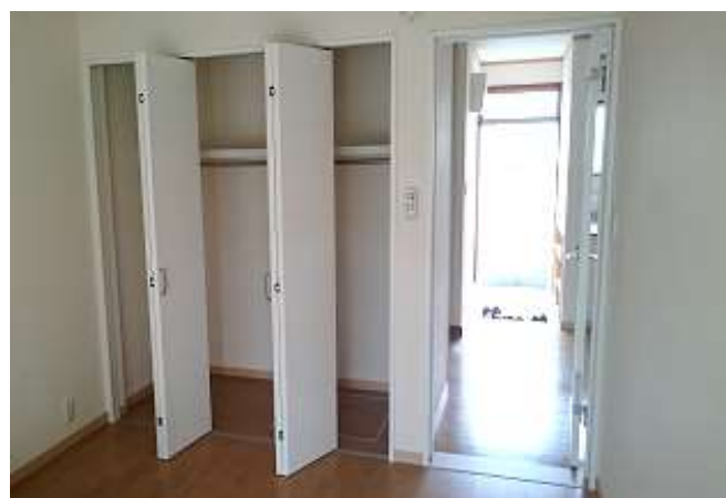
女子寮③ 生徒個室（入口側）。収納スペースは十分。奥が玄関。