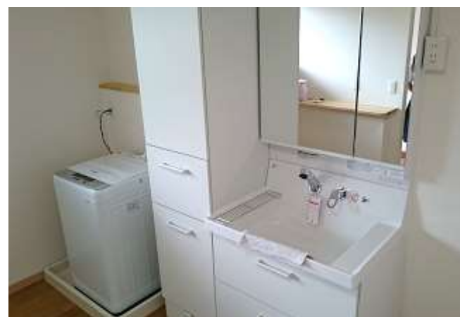
女子寮④ 洗面所と洗濯機。2名で共用する。