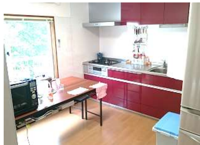
女子寮⑥ 食堂の調理スペース。給食員が朝食と夕食を準備する。