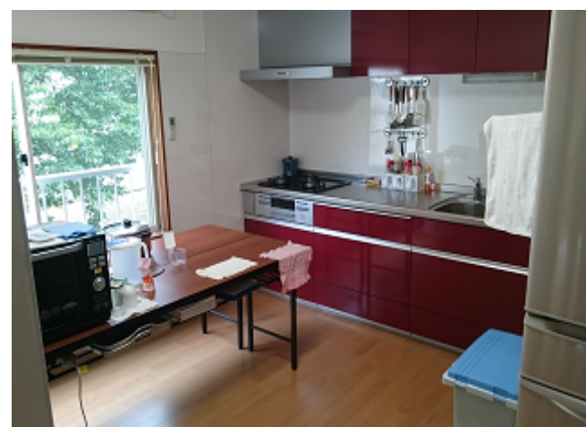
舎監が食事を準備する食堂の調理スペース。