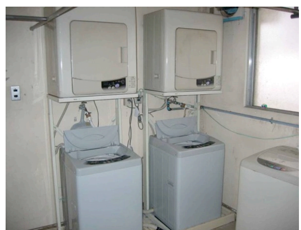
洗濯室。全自動の洗濯機と乾燥機があります。 自分の部屋で干すことも可能。