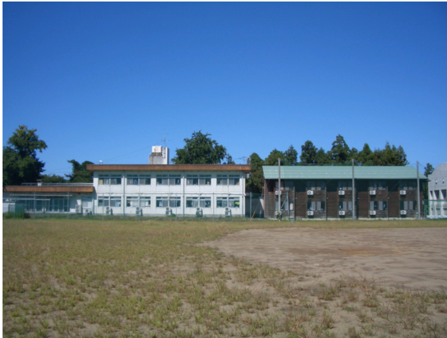
男子寮全景 校地内にあり 生徒玄関まで徒歩数分