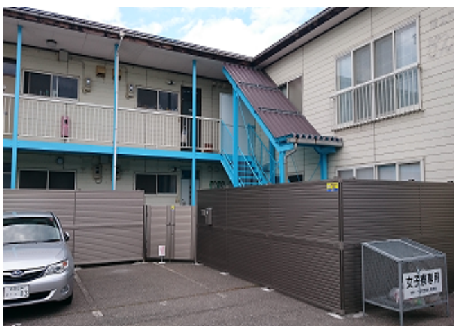
女子寮全景。平成 27 年に教員住宅を改装して設置。