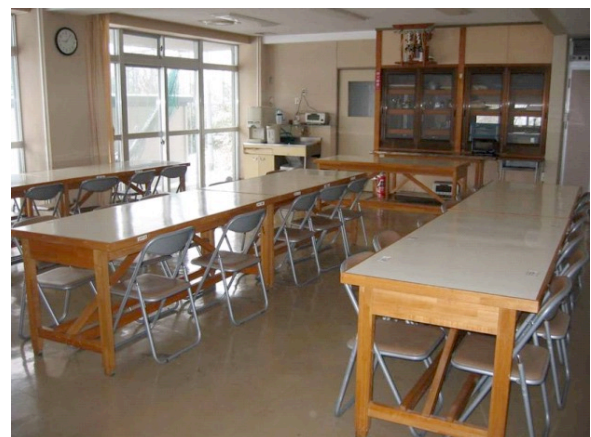
食堂。50 人が一斉に食事できる。DVD プレーヤーやポット、電子レンジ、冷蔵庫が使える。