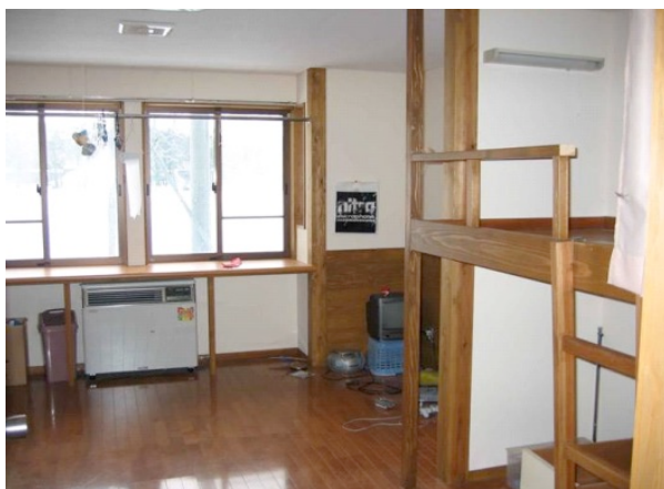
生徒部屋。冷暖房完備。