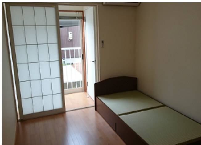
生徒個室（窓側）。2DK を 2 人で使用。 暖房完備。テレビ設置可。