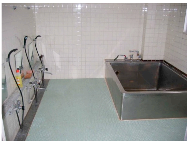
共同浴室。入浴時間帯に順番に入る。