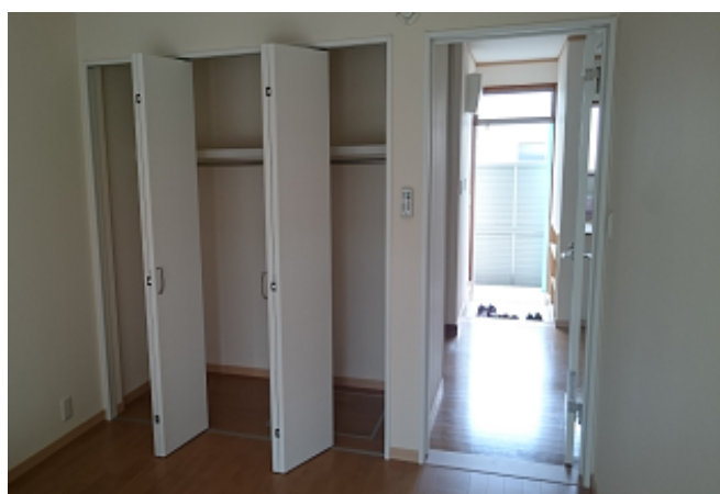
生徒個室（入口側）。十分な収納スペース。