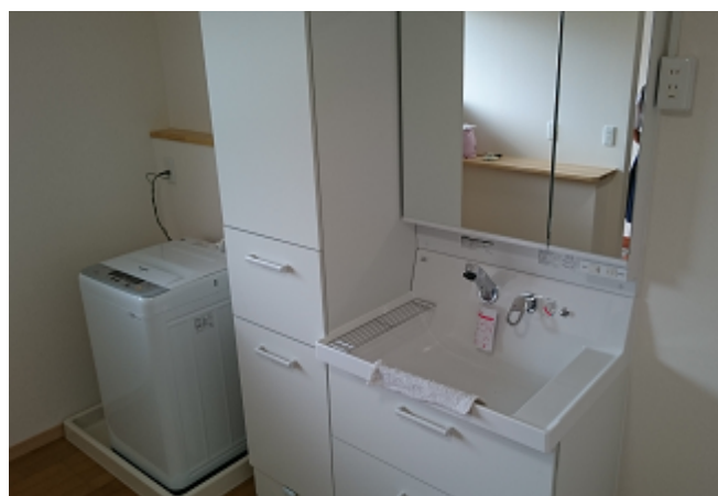
洗面所と洗濯機。2 名で共同使用する。