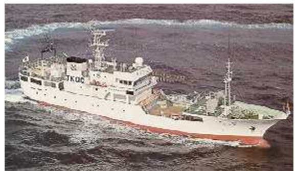
大型実習船「海洋丸」(299トン)

人間として調和のとれた育成を目指し、一般的な教養を高め個性を生かす教育の充実に努め、社会の変化に主体的に対応できる能力を育て、望ましい職業観、勤労観を育成する。