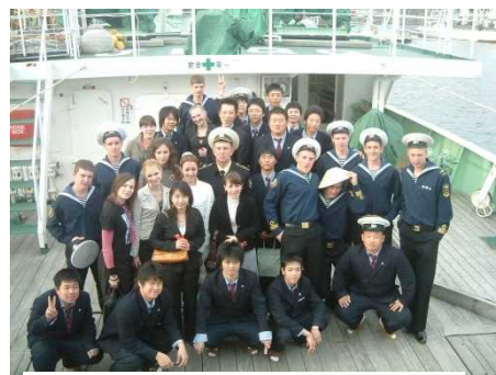
海洋丸でのロシア国際交流航海